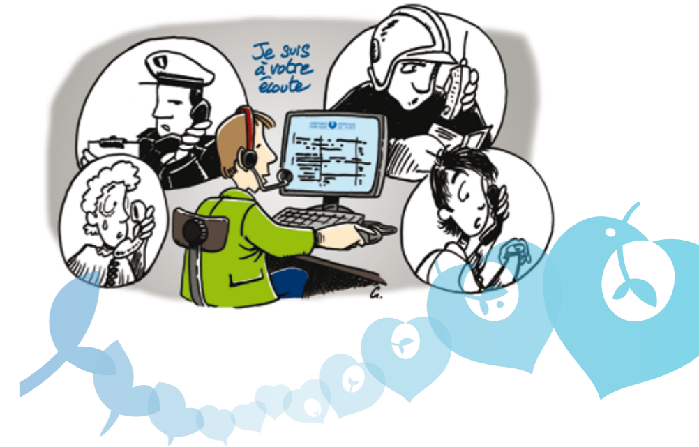
© 2012 - AP-HP - DSFC/Département des droits du patient et des associations - Illustration de couverture : Gérard Braïda

Comment savoir si une personne est hospitalisée à l'AP-HP ?